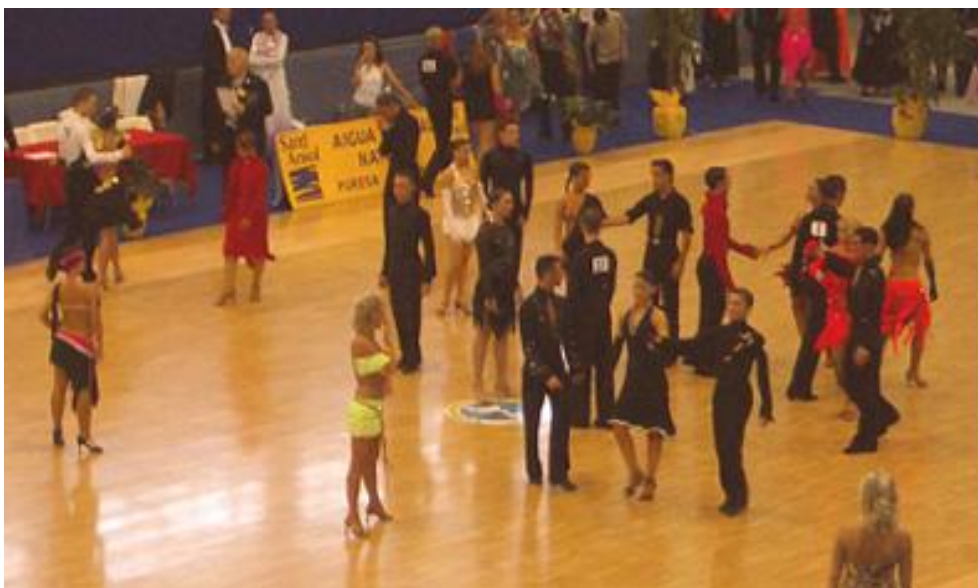
Parelles preparades per a competir en Llatins Estil Internacional