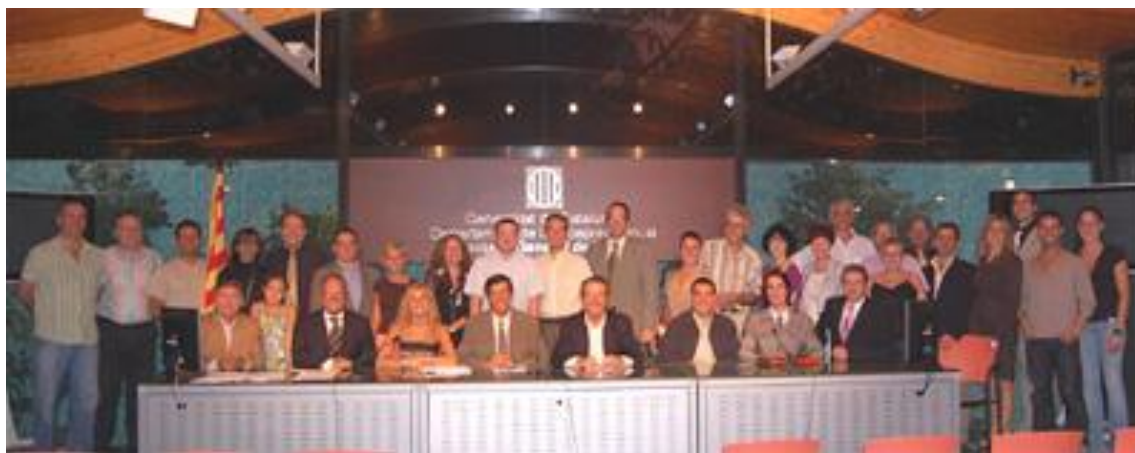
Junta Directiva i Presidents dels Clubs Fundacionals el 13 de setembre al Palau Melcior Colet (Barcelona)

Finalitzada l'etapa com a Unió de Clubs, el passat 13 de setembre, amb l'assistència dels representants dels clubs fundacionals i dels clubs adherits, es va dur a terme l'acte fundacional de la federació, amb la qual cosa Catalunya comptarà amb la primera Federació de Ball Esportiu a l'Estat espanyol, fet que ens omple a tots de satisfacció.