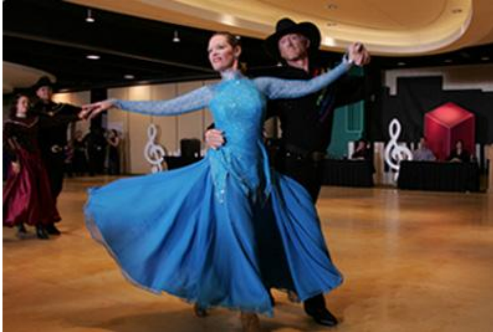
Parella en competició de Country Western

La FCBE compta amb una Selecció Catalana de cada una de les dues especialitats, representant a Catalunya a nivell internacional.